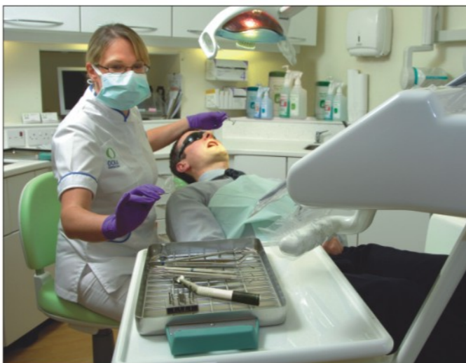
Набор стерильный инструментов и турбонаконечников для каждого пациента.

Бережный режим стерилизации в автоклаве Statim и сокращение продолжительности стерилизации дорогостоящих наконечников для бормашины увеличивает срок их службы. Новый принцип стерилизации: скорость обеспечивает экономию средств.