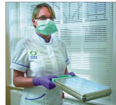
Контейнер стерилизатора Statim удобен для перемещения стерилизованных инструментов.

Statim также сам контролирует надежность цикла стерилизации. Микропроцессор прерывает цикл, если не соблюдены надлежащие параметры температуры, давления или времени. Можно быть уверенным в том, что если следовать простым указаниям на кнопочной панели, то полностью автоматизированная операция завершится стерилизацией всех твердых, полых, завернутых или незавернутых инструментов.